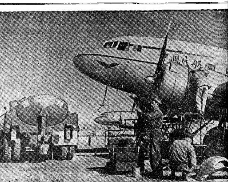
Хятадай Арадай Республикын гражданска авиаци ехэ амжалта тухай 1957 ондо хараалагдахад орходоо 60 процентээр олон хүнийг авиаци үнгэргэгшэ жэлдэ зөөн байна. Хятад дотор 18 агаарай зам нээгдэ хэй. Ороной гражданска авиацида эбдэрхэ, гэмтэхэ ябадал нэгашы үзэгдэнэ. Куньмин (Юньнань провинци) городтохи авиаци Хятад эгээн томо портнуудай нэгэн юм. Аэропортын байшан соо зоной хүлэежа нууца амарха таагууд, ресторан, банкын отделени, почто бин. Куньминска аэропорт ороной баруун-урда хубине Хятадай бусад хубинуудтай харилан болгохооо гадна, Хятадай Арадай Республикын болон Зүүн-Урда Азины нуудай хоорондох агаарай зам дээрэхэ тон шуухала пункт юм. ЗУРАГ ДЭЭРЭ: Куньминска аэропорт дээрэхэ нийдэхэ самодетелье байна.