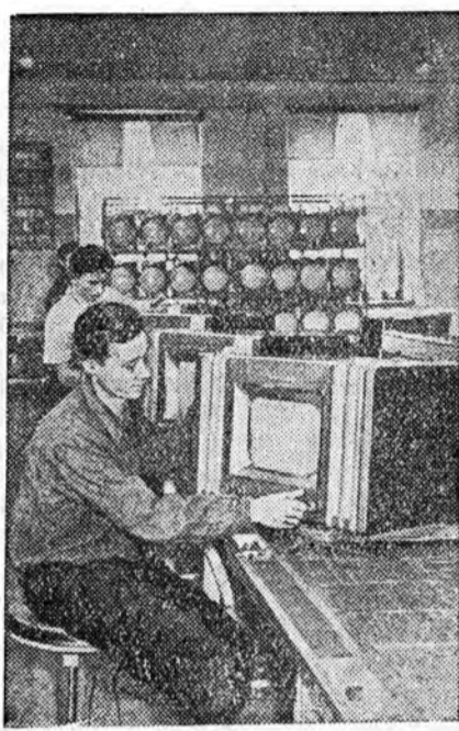
Красноярск. Телевизорнуудые бүтээгч Красноярский завод «Авангард-55» гэжэ телевизор гаргадаг болоо.