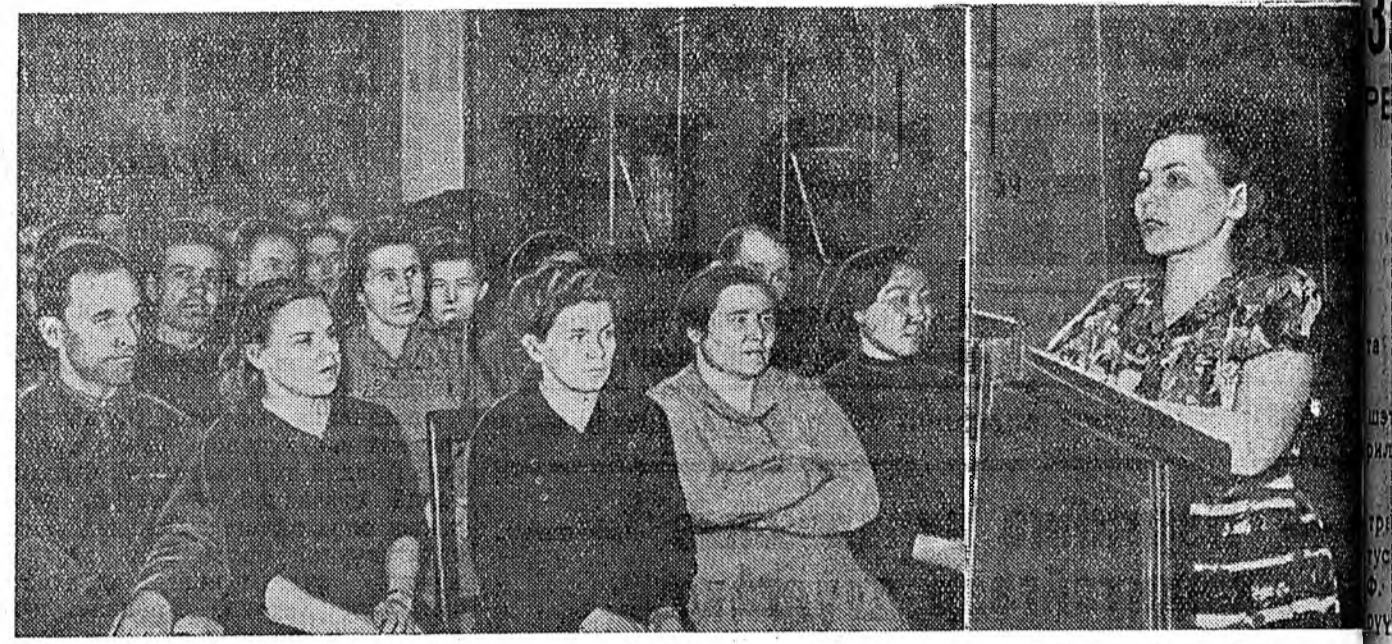
Гүрэнэй банкын Бурят-Монголой республиканска, конто-рын хүдэлмэрилдэд урьһаламжанууд тухай БИСС-эй ЦБ-гэй зүгһөө Н. С. Хрущевый оруулан дурдахалы ехээр һайшаан угтаа. 1958 онһоо эхлэн урьһаламжа захихала болхо, энэ жэлдэ бага урьһаламжа бэшүүлхэ, облигацинуудай сэнгьен түлэхэ болзорые хойшолуула дурдахалы тэдэнэр нэгэн дуугаар һайшаажа дамжаа.

Мао Цзэ-дун, Лю Шао-ци, Чжу Дэ, Чжоу Эн-лай нүхэр К. Е. Ворошиловой гарынь баряад, үгэ хэлэнэһэнэй түлөө тэрэнэд үшөө дахин халуун байсхалан хүргөө. Зал соо уни удаан замхашагүй ован болоо.