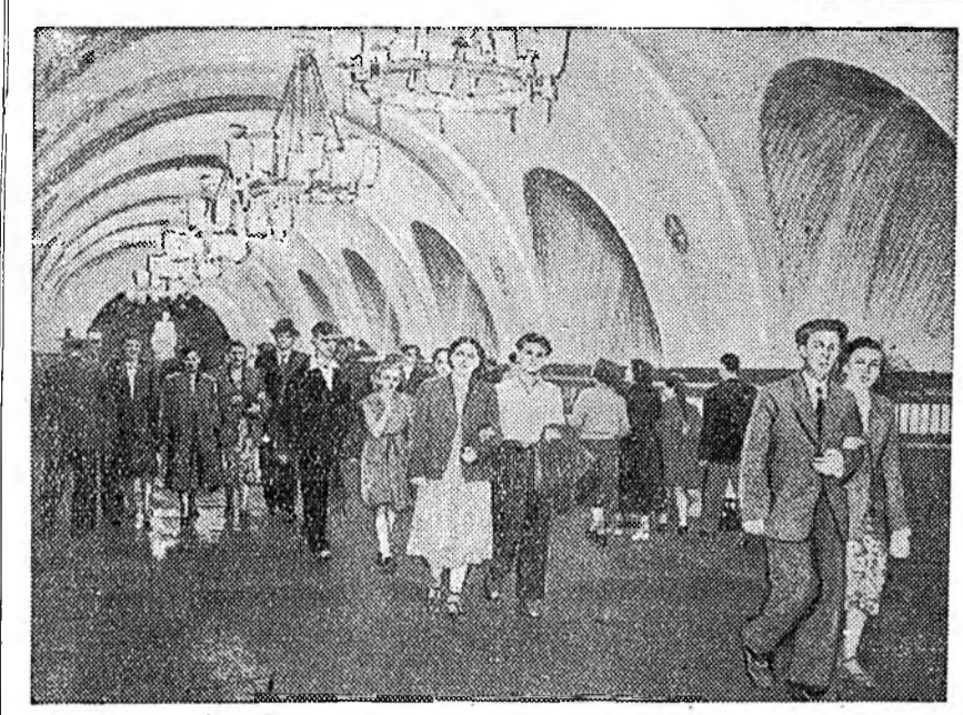
Москва. Крымскэ талмайһаа Дужиндэ хүрэтэр ошодог метрополитенэй Фрунзевскэ радиусай түрүүшнэ үеэс майн 1-дэ ашаглалгада оруулагдаа. ЗУРАГ ДЭЭРЭ: «Фрунзевская» гэжэ метрогой станци соо.