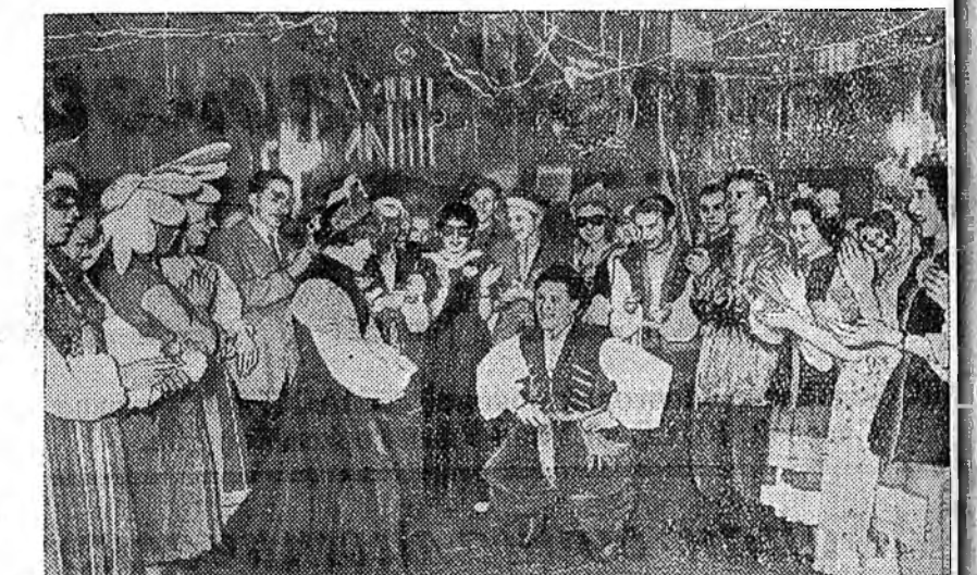
Ленинград. Городей залуушуул Бүхэдэлхэйн VI фестивалда бэлдэнэ байна. Олон предприятинуудта вечернууд үнгэрэгдэнэ, концертнууд болоно. Тийска заводой судна барилгашад залуушуул Орджоникидзын нэрэмжэ клубта сугларжа, ехэ хонирхолтой вечер үнгэрэгдэбэ. Уралбайханай самодельносьтед хабаадагшад олон дуунуудыг дуулажа, хатар наада табиа. ЗУРАГ ДЭЭРЭ: арадай пяскануудыг эрхим найнаар наадаһан түлөө көндө үнгэрэгдэжэ байна.

КПСС-эй айкомой секретарь нүхэр Балдановай манай редакцида мэдээлэнэй ёһоор, статья соо хэлэгдэнэ баримтанууд булта зүб байба. Редакциин хүдэлмэригэшэйдэ зүблөн үнгэрэгдэжэ, редакциин хүдэлмэригэ найжаруулжа тушаа тодорхой хэмжээ-ябуулганууд хараалагдаһан байха юм.