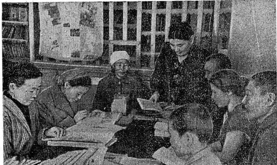
ЗУРАГ ДЭЭРЭ: Здын аймагай Енхор тохонхой хүдөөгэй библиотека соо. Энэ библиотека 5 мянга шахуу номтой, 100 гаран уншагшадтай, хоёр нүүдэл библиотечкэтэй.

Һаари хүйтэн һаад хээгүй. Байгаали ижэ Байгал тээшэ Замыш таагаа гү, Золыш заагаа гү, Сэлэнгэ, Сэлэнгэ, Сэлэнгэ!