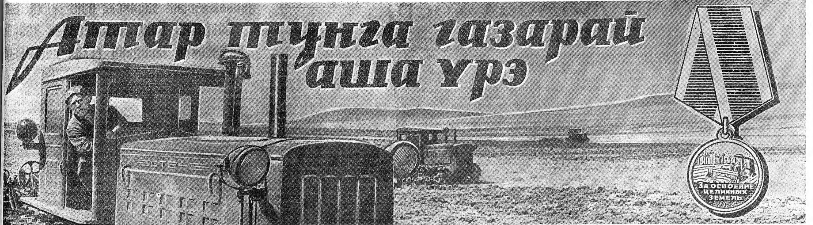
Гүүлэй жэлнүүдтэ Цагаан-Усанай МТС, тэрэнэй харьяата колхозууд 21.408 гектар шэнэ газар хахалаа. Энэ ехэ хүдэлмэрийн аша үрэ тухай доро бэшэгдэбэ