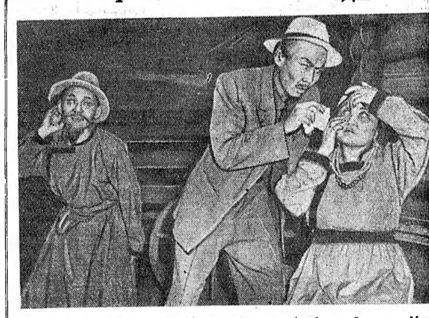
Ленинэй орденото Бурят-Монголой оперо