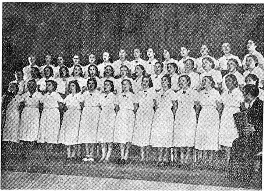
Залуушуулай бүхэсөзона фестивалда хабаадалсахын түлөө зональна конкурсо манай республикаһаа эшхоо залуушуулай тоссоото концерт хаяхан болоо. ЗУРАГ ДЭЭРЭ: педучилищин хоор дуу дуулажа байна.

лөө. Тус аймагй худалдаа наймаанай эмхи зургаанууд түсэбһөө гадуур 179 мянган түхэригтэ эд бараа худалдаа. Мүн тэршэлэн Курумканай, Мухаршэбэрэй, Хэжэнгын аймпортресозауд муу бэшэ дунгүүдые харуулан байна. Худалдаа наймаанай хүдэлмэришэд энэ туйлаһан амжалтануудаараа ханаагаа амарангүй бүри оролдосотойгоор ажаллажа байна. Д. Колмаков.