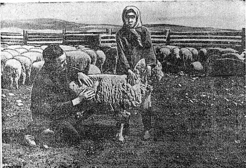
Сэлэнгын аймагай Тельманэй нэрэмжэтэ колхоздо нубайран, хурьга хаяһан, хурьга-найнь үхэн хонид, мүн аһагууд—хамта 1200-гаад толгой хонид ерэхэ намар-үбэл-доо шэнэ жэлэй гар-тар хурьгалуулагда-хань. Эдэ хонид муноо илгадажа байнхай. Намар тэдэнэр нооноо хайшалауулаад, искусственина аргаар үр-жүүлэхэ уялга хо-нидой ноононой хур-хоорьжэ, тоно нэлбэ-жэ байһы шалгажа байна.

Е. Устинов, Баргажанай аймагай Лениний нэрэмжэтэ колхозой түрүүлэгшэ.