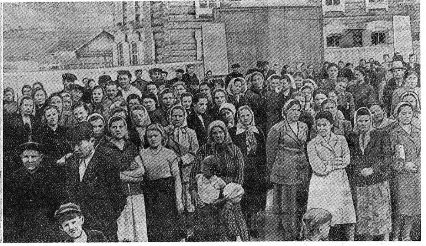
Хэлсэхэ митинг үнтэргөө.