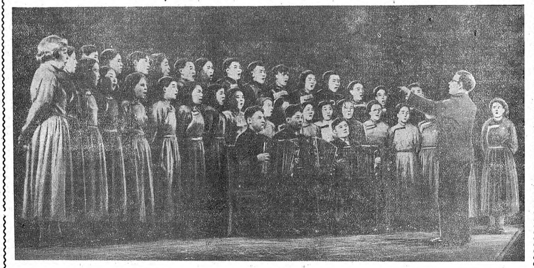
Фестивалин түрүүшын үдэ хоорой конкурс эхилээ. ЗУРАГ ДЭЭРЭ: Закаменай аймагай хоор дуулажа байна.