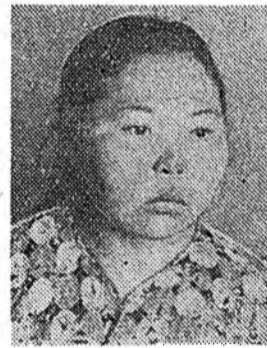
мар, үбэлдөө 2400 гаран хэрмэ алажа, гүрөндө тушаагаа, Хабар, зунай сагта колхозойнгоо оро адуудад, тугал-

Би эгээл түрүүшынхэ аяар холын Баунтын аймагнаа манай республикын столица Улан-Удэ залуушуулай һайндэртэ ерэббэ. Агнуурин ажал эрхилдэг «Путь коммунизма» гэжэ түрэл колхознай аймагай центр Багдаринһаа оро унаад ябаханда, хоёр хоногой газарта юм. Фестивальда бидэ бүри намарһаа хойшо бэлдэбди. Залуушуулай энэ һайндэрэе ажалай бэлэтгэйтгээр угтаа гэжэ биньсе оролдооб. Түрүүшын жэл агнаһан байгашыне һаа, би на-