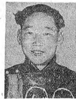
лаа гамнахагүй байнабди.

Колхозойнгоо һингын ажахын улам баяхжэн хүгжэжэ хэрэгтэ бидэ, залуушуул хүсэ шада-