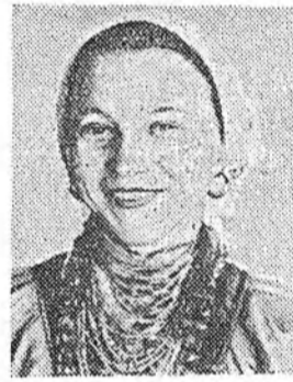
на, сүлөөтэй сагтаа сэнгэн зугаалха, дуулаха, хатарха дуран хүрэдэг. Һайнаар архадаа бүри эршөөлтэйгээр ажалла-

Манай эвенгогхид кукурузаа хаба саг соонь, һайн хурьһетэй газартаа квадратногнөздөвэй аргаар, заримынь гараар таряабди. Мүн гансал һайнаар ажаллаад ябаханаа гад-