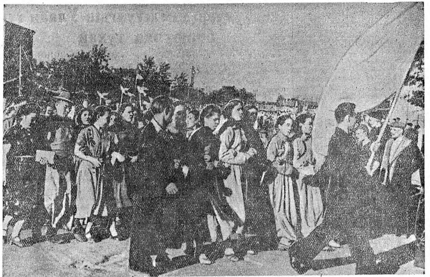
ЗУРАГ ДЭЭРЭ: Фестивальда хабаадагшад «БМАСССР-эй XXV жэлэй ойн» нэрэмжэтэ стадион тээшэ оножо ябана.