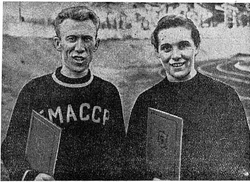
Ч. Сыжипова барание ахин гараа.

Гурбан язын мурьсөөгөөр Бурят-Монголой түлөөлөгшэ