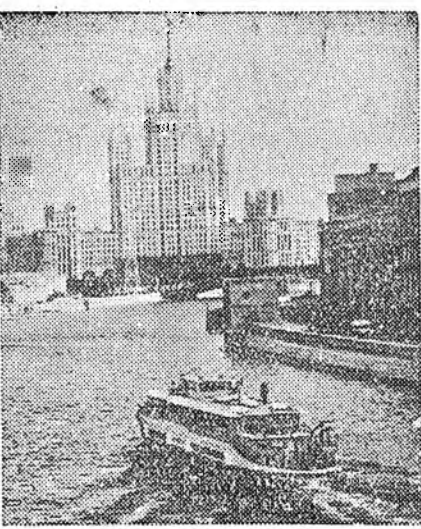
Москвагай судна бүтээлгын, мүн судна заһабарилгын заводто «ОМ-323» гэжэ пассажирска теплоход баригдажа дүүрбэ. ЗУРАГ ДЭЭРЭ: «ОМ-323» гэжэ пассажирска теплоход Москва мурэн дээгүүр ябуулагдажа, туршан шалтагдана.

Кубаниин олон районуудта таряа хуряалга һайнаар ябана. Мүнөө Краснодарай хизаарта 30 миллион гаран пүүд таряан гүрэндэ тушаагдаа байна. Тингэжэ нёдондой энэ уеынхидэ ороходоо 15 дахин эхэ таряан тушаагдаба.