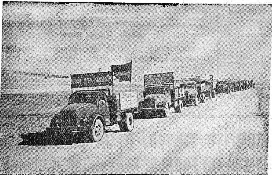
Узбекистан ССР. Республиканын колхоз, совхозуудта тарьян хаа хаанугуй хуряагдажа байна. Самаркандын областийн Зааминская районий «Ударник» совхозой поли дээр 50 гаран комбайн хүдэлнэ. Механизаторууд гурбан комбайнуудыг хувиаруулан шатгалжа, ехэ амжалтаатайгаар тарьяагаа хуряана. Тарьяа сөбөрлөхө, мүн тарьяны ашаха хэрэгтэ тарьянай пултнууд, тарья ашадаг түхээрлэг болон шэнэ шэнэ бусад техникэ үргэнөөр хэрэглэгдэнэ. Шэнэ ургасын тарья ашахан түрүүшын автомобильнууд энэ совхозоо элеватор эльгээгдэе.