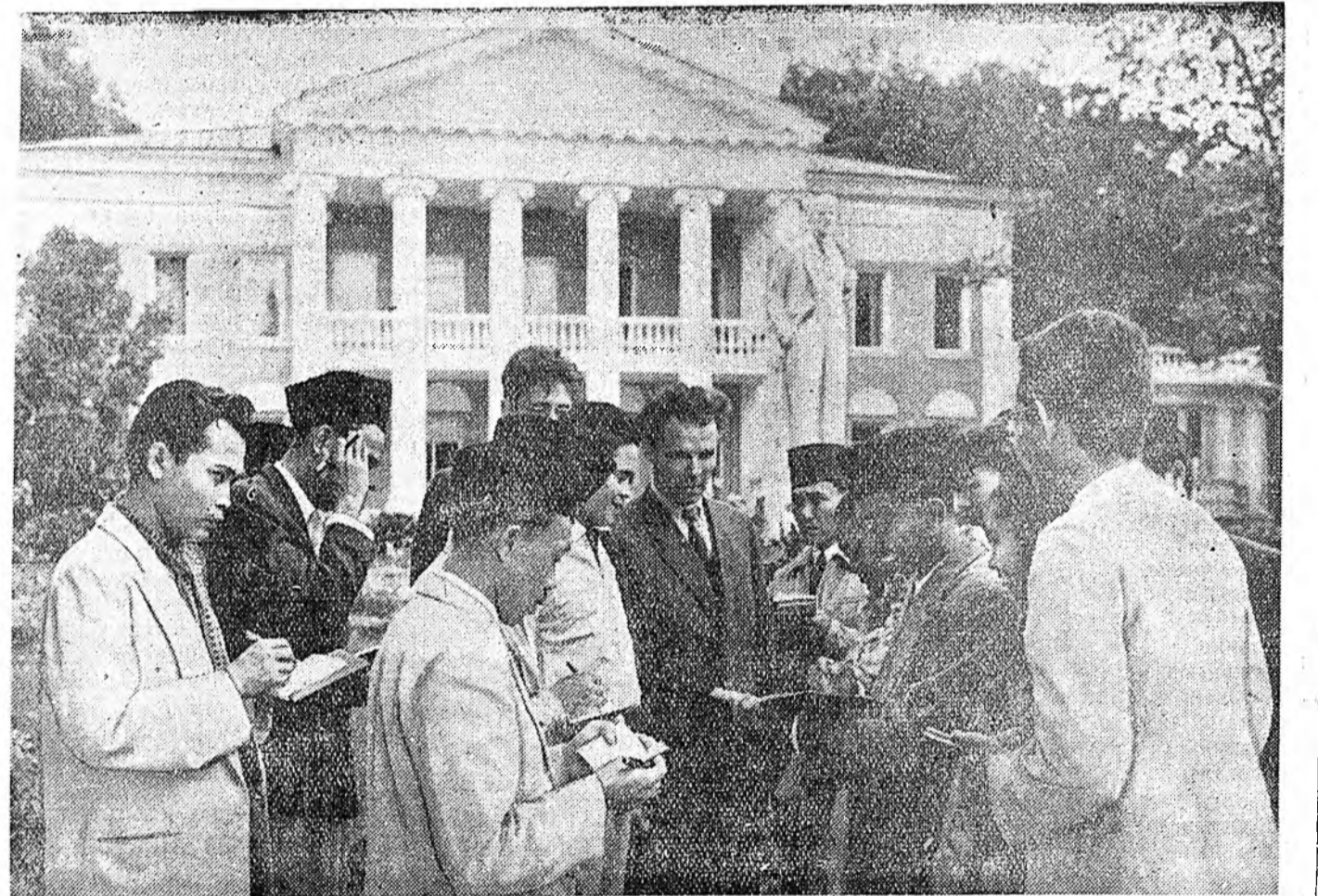
Москва. Залуушуулай болон студентуудай Бүхэдэлхэйн VI фестиваль. ЗУРАГ ДЭЭРЭ: Ленииска Горкинуудта Индонезийн делегатууд В. И. Лениней Музей-байшангай хажууда байна.