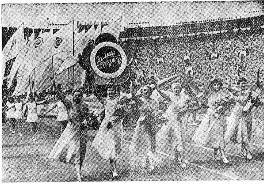
Москва. Залуушуулай болон студентуудай Бүхэдэлхэйн VI фестиваль. В. И. Лениней нэрэмжэтэ центральна стадион дээрэ фестивальда хабаадагшад

Уулзалгада хабаадалсагшад хамтын мэдүүлгэ баталан абаа. Залуу ханинаар Голландин ба Финляндиян дуунуудые дуулаба. Суриннаһаа ерэнэн айлшад өөһө- * * *