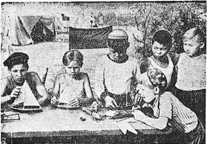
Эдир техникүүдэй Улан-Удын станцида үхибүүд олоороо сугларжа, элдэб янзын юмандуудыг бүтээжэ хурана.

ЗУРАГ ДЭЭРЭ: бүгд үхибүүд парусна онгосонуудыг бүтээжэ байна.