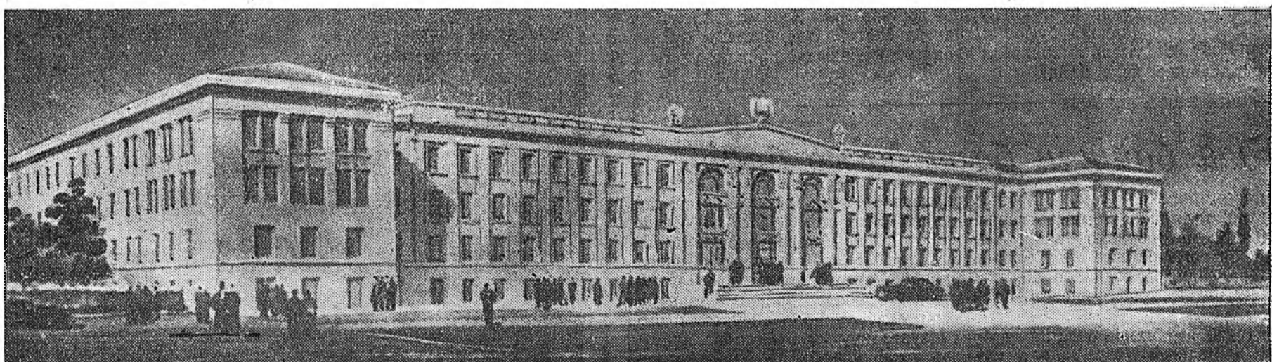
ЗУРАГ ДЭЭРЭ: Бурят-Монголой гурван зооветеринарна институтай байһан.

Гэбэшье, барилгын нимэ ехээр абуулагдажа байбашье, факульте-