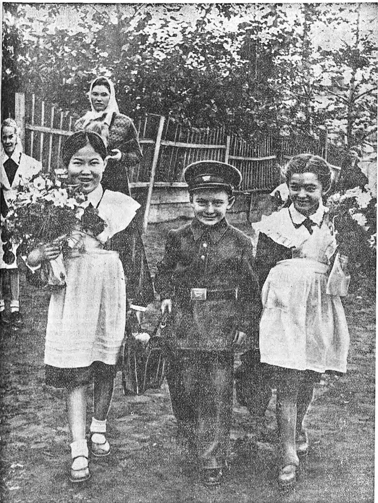
Улан-Удын хоёрдохн хургуулиин хурагшад.