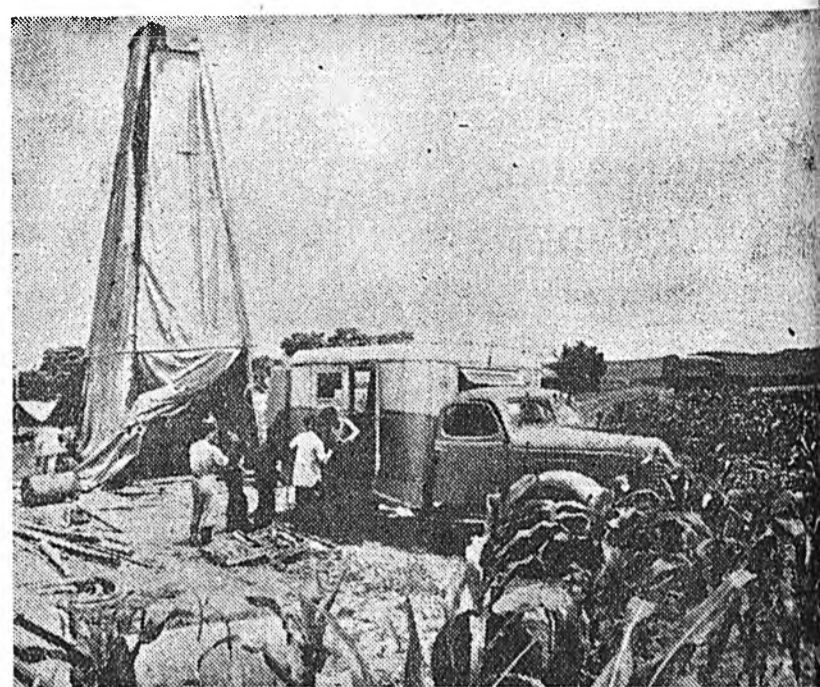
Хитадай Арадай Республикада һүүлэй жалнуудта амагта малтамал бээр худалмэри үргэнөөр ябуулагдажа, амагта малтамалай олон шэнэ хабтэһаар доо.

ЗУРАГ ДЭЭРЭ: Хитадай баруун хойто зүгтэ геологууд туршалгын дэлгэ хэжэ байна.