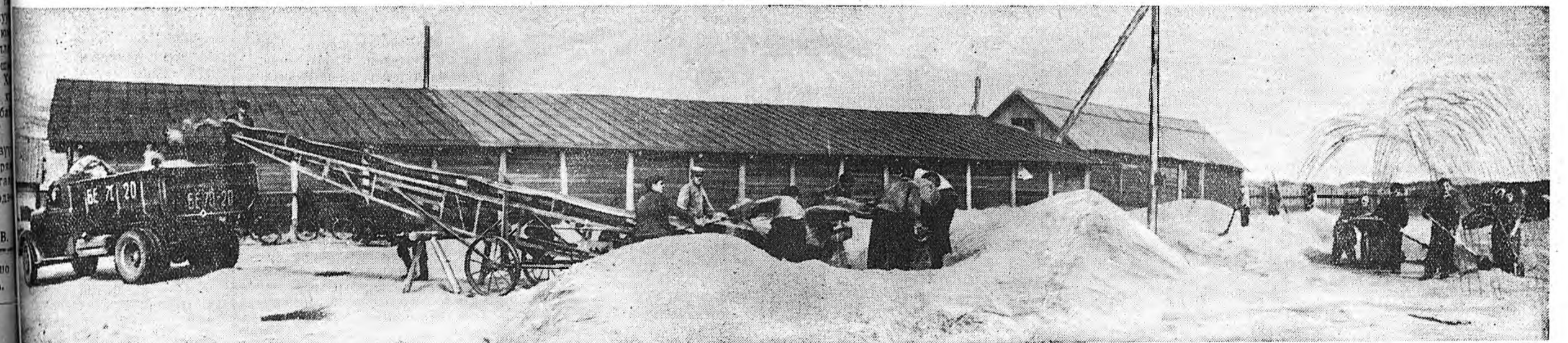
ЗУРАГ ДЭЭРЭ: «Рассвет» колхозой тарьянай тоог.