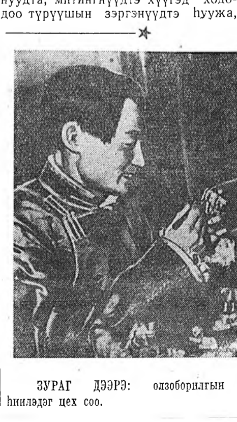
ЗУРАГ ДЭЭРЭ: олзоборилгын кооперацийн 9-дэхи артелиин уран гоёр һинлэдэг цех соо.

Пионерэй лагерьта, аймагуудта, суглаанууд болон митингүүд дээрэ бидэнэр олон хүүгэдтэй уулзаабди. Тэдэнэр ехэ һонирхууша, хүндшэ, томоотойнууд, журам заршам-тай хүүгэд байха юм.