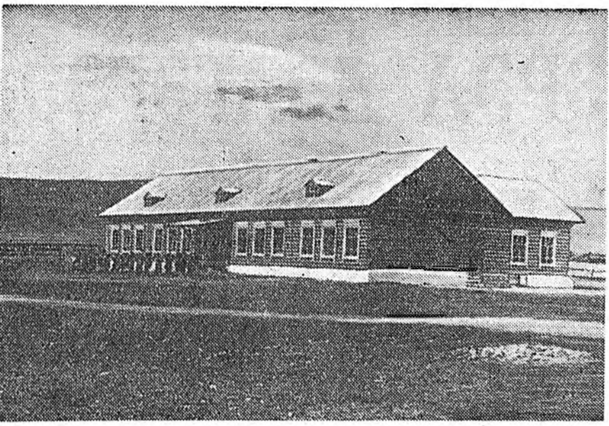
ЗУРАГ ДЭЭРЭ: Заиграйн аймаг Ацагат нутагта барилдсан долоон жэлэй хургуулийн шэвэ байсан.