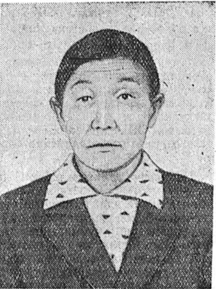
жа абанан 14 үнэһнээ 14 тугал абажэ бүрин бүтнөөр мал болгооб. Үнээн бүринөө 1377 литр һу һаагаад

Революцин урда тээ бурят эхэнэрэй байдал гэшнэ тон хүндэ байһан юм. Гүрэн түрн хэрэгтэ хабаадсалса политическэ ямаршыс эрхэгүй, үзэг бэшг мэдэхгүй үгли харанхы байһынгаа хажуугаар, бурят эхэнэр гэр бүлэ соогоо барлагын байһан юм. Айлай бэри гэшэ сэргэдэ гурбан морной уяатай байгаа һаа гэртэ орохо эрхэгүй, гэр соогоо галайгаа баруугаар ябаха эрхэгүй, хадам эсэгынгээ байхада уужаяа тайлаха эрхэгүй байһан юумэл даа. Мүнөө манай оройной бүхы эхэнэрнүүд, тэрэ тоодо бурят эхэнэрнүүдыс, эр хүнүүдтэй тон адли эрхэтэй, гүрэнэй, политическэ, ажахын ямаршыс ажалда хүдэлдэг, ехэ үндэтэй хүнүүд болоһой гээшэ. Би өөрынгөө колхоздо 24-дхи жэлэ һаалишанаар хүдэлжэ ябанаб. Наһатай болонхойшыс һаа, Америкуе һу, мяха, тоһо абалгаар хүсэхэ гэхэн тэмсэлэй дэлгэржэ байхада, гэртэ һуунгүй, үшөөл шангаар хүдэлхэ, өөрынгөө ажалда залуушуулыс хургаа хүсэлтэйб. Мүнөө да-