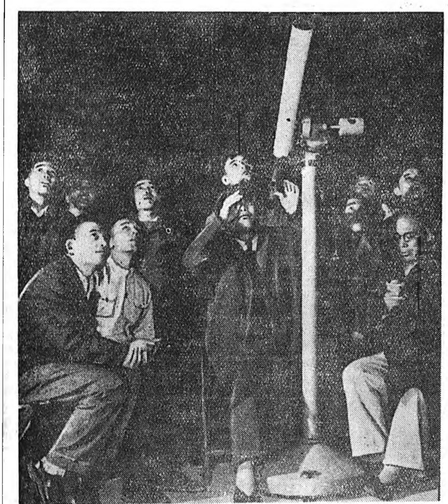
Бумбэрсэг дэлхэйе тойрон дабшаха түрүүшын хэмэл одоной хойноһо Пекиний «хүн» зон адаглан харана. ЗУРАГ ДЭЭРЭ: Пекиний эрдэмтэд хэмэл одыс хаража байба.