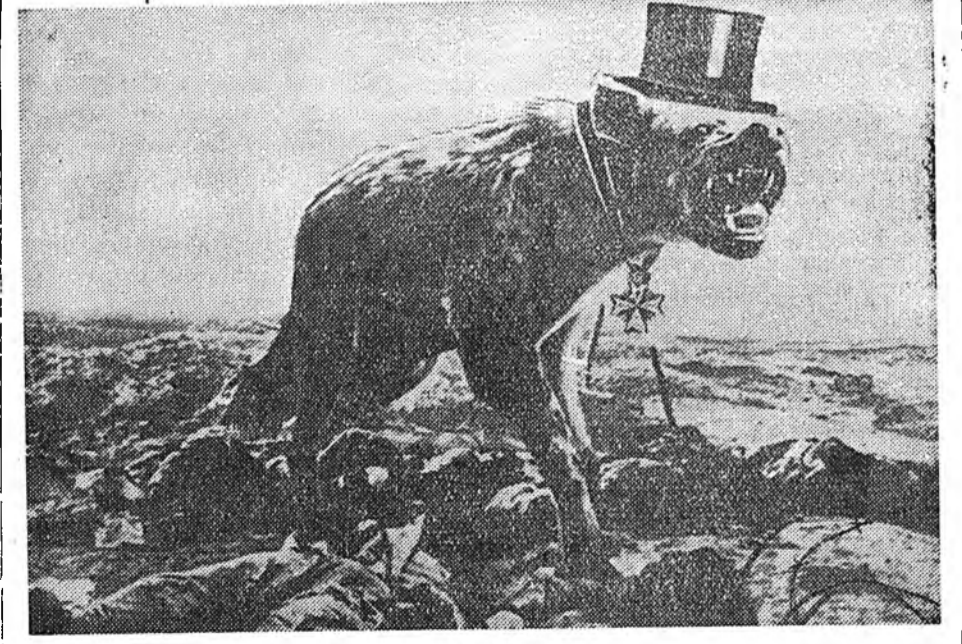
Германска Демонотическа республика. Уранзурааша Джон Хартфилд гэгшын зурагуудай выставкэ Берлиндэ нээгдһэн байна. Тэрэнэй зурагуудай олонхынэ бүри 30-аад онуудта зурагдаһыншье һаа, мүнөө болотор политическэ удхашанара таблагуй байһаар.

ДАМАСК, октябрийн 12. (ТАСС). Сирийн хилэ шадар Турциин сэрэг асаргадайд байна гэжэ «Аль-Джумхур» газетэ бэшэнэ. Жэсэнэнь, Турциинх 5-дахы бронетанков дивизион Сирийн хилэдэ дүтэлхэ гэхэн захиралта Хойто-Атлантическая бүлгэллэй Совет хаяхан үгөө. Америкын мэдээжэ нэгэ офицер энэ дивизион толгойлоо. Мүн 170 танктай подразделени энэ шивэзид хамжуулагдаа. Тингээжэ танкнуудтэ бүхы дүн 670 танк болобо гэжэ «Аль-Джумхур» бэшэ. Сирийн хилэһээ коло бэшэ Александреттын шадар танкнууд зогсоогодо. Хамтадаа 30 мянган солдат, офицернуудтай Турциин сэрэг Сирийн хилэ тээшэ дүтэлжэ ябана гэжэ газетэ мэдээсэһэнэ. Сиридэ дайгаар орохо түсэбэй зохёогдоод байһан тухай Турциин сэрэгтэй Сирийн хилэ шадар асаргадайдан ушар харуулна гэжэ мэдээсэл соо онсолон тэмдэглэгдэнэ.