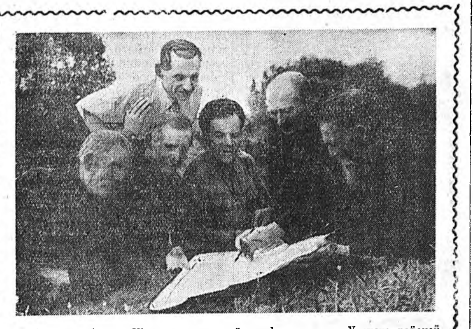
Брянская область. Шорстой сугтаа дайладалан сөөргшөд Унеческэ районий Нийтонович тосхондо олоороо ажлуудаг. Эдэнэр мүнөө үедэ «Ворошиловай» нэрэмжэтэ хүдөө ажахын артелиин гашууд болонхой.

Занятинь эмхитэй һайнаар үн-гэрөө. Агууехэ Октябрин социалистическэ революциин илалта ба СССР-тэ пролетаридай диктатуриин батажан мандалга тухай про-пагандист хуралсалашалта тодорхой-гоор хөөрөжэ үгэбэ.