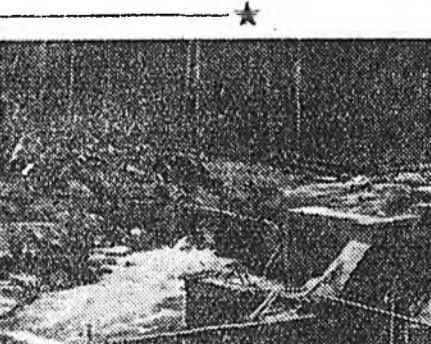
ЗУРАГ ДЭЭРЭ: Халуу булгаар албэг хангил үндэр уулаһаа шууян хүүһэн бууддаг турган урасхалта Курумкан гол дээрэ Курумкан тосхонһоо хойто арбаад модоной газарта баригдажа байһан колхоз хоорондын Курумканска ГЭС-эй барилга харуулагдаа.

Тэршэлэн Калининэй, Сталиной нэрэмжэтэ колхозуудай хонишод ехэ амжалта туйланхай: хонин бүриһөө 3075—3148 грамм нооһо хайшалаа.