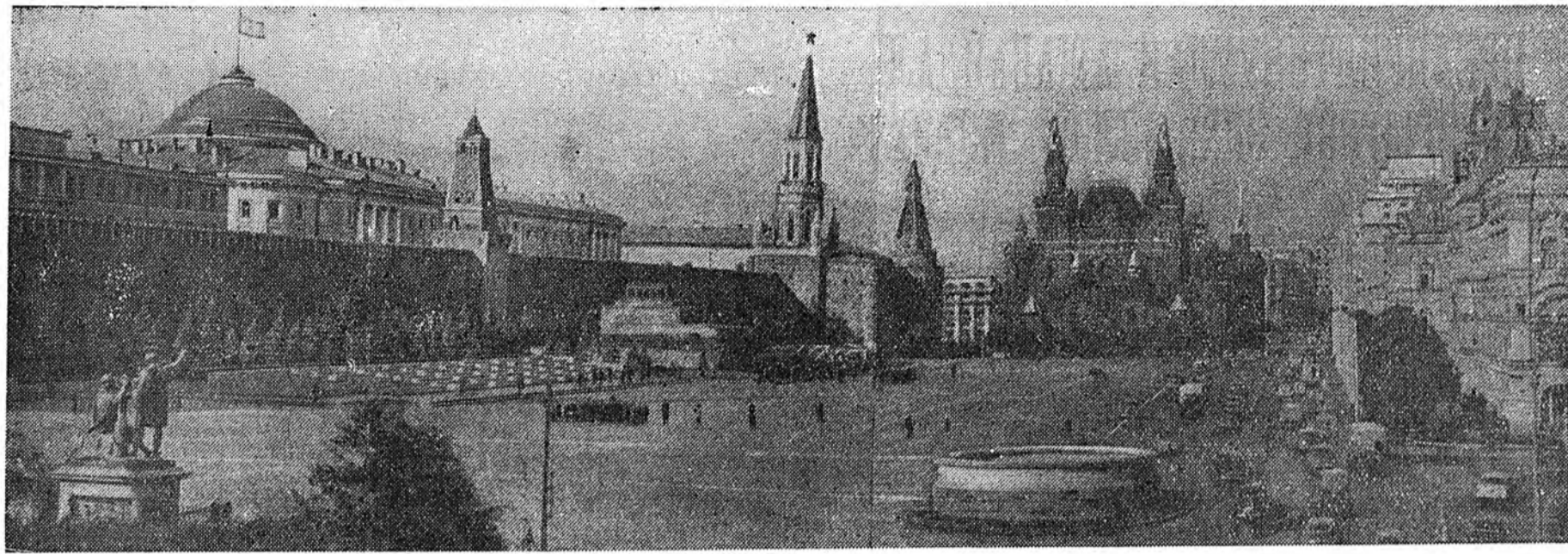
Москва. Суута Улаан талмай.