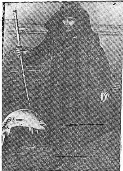
Загашанай хүсэл...