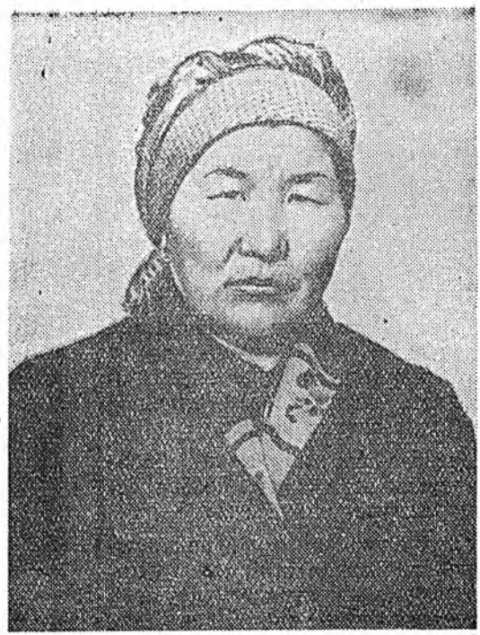
Мүнөө жэлэй дүүрэтэр үнээн бүриһөө үшөө 300 литр бу баахын түлөө тэмсэжэ байхаб.

Яагаад нимэ амжалта туйлагдааб? Үнээдтэ тус тустан уяад байлдаг болообди. Тинхэдэ үнээдтэ тус бүридөө