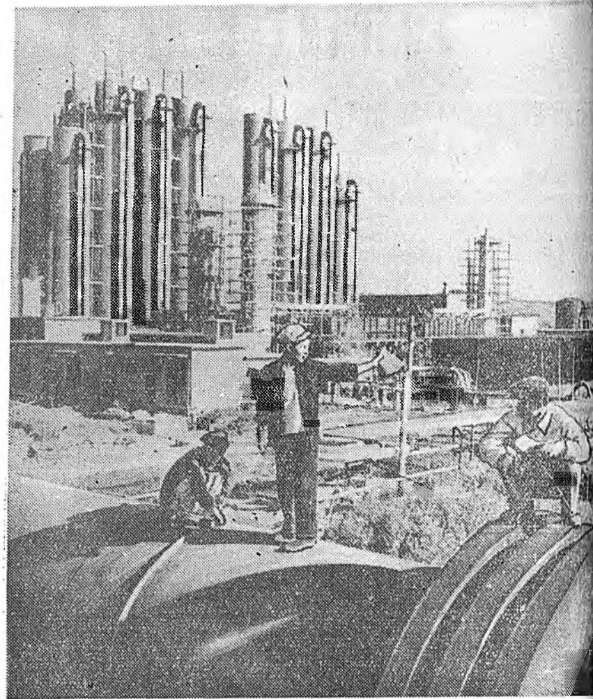
Хитадай Арадай Республика. Оройной зүүн хойто зүгтэ нүүрһэ эгээл шаабад нютаг болохо Фунуль гэжэ газарта арадай засагай жэлнүүдтэ мун нүүрһэ эхэр абадаг болоо юм. ЗУРАГ ДЭЭРЭ: нефть сөбөрлэдэг № 2 заводой үйлдбэрийн объектүүдэй харуулагдана.

Турциин хилэ дээрэ байдалай шангадананай дашарамдуулан, Сирийн правительство элжээдэ бэшэ заседания ноябрийн 11-дэ үнгэргөө гэжэ мэдээсэгдэнэ.