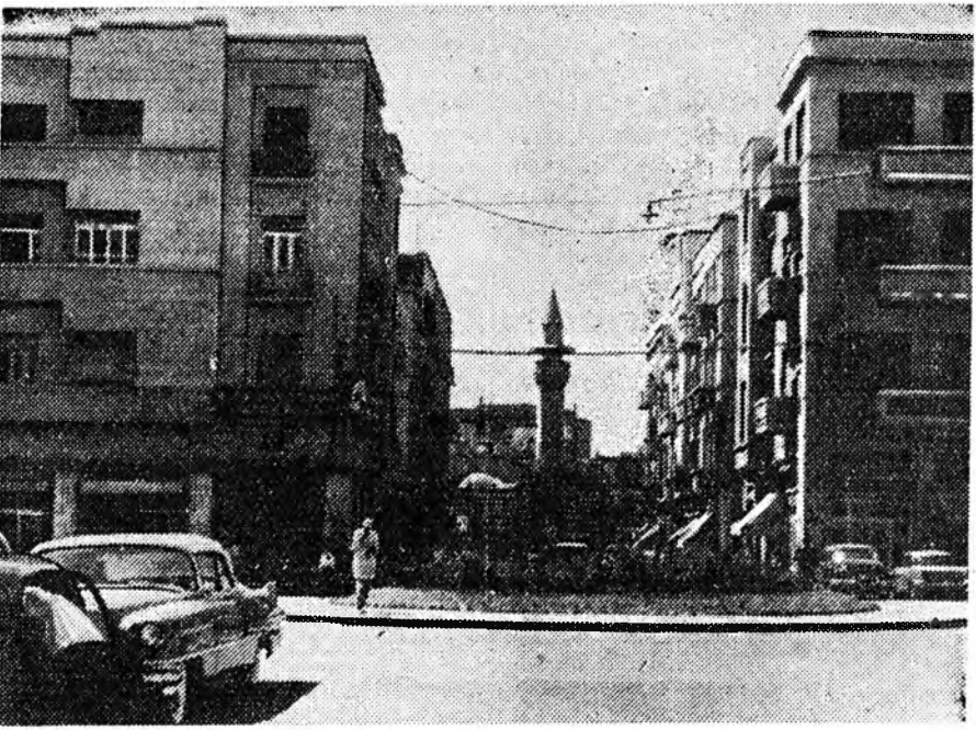
Дамаск. Сирийн нинслэл хотодохи худалдаа наймаанай, финансова центр.