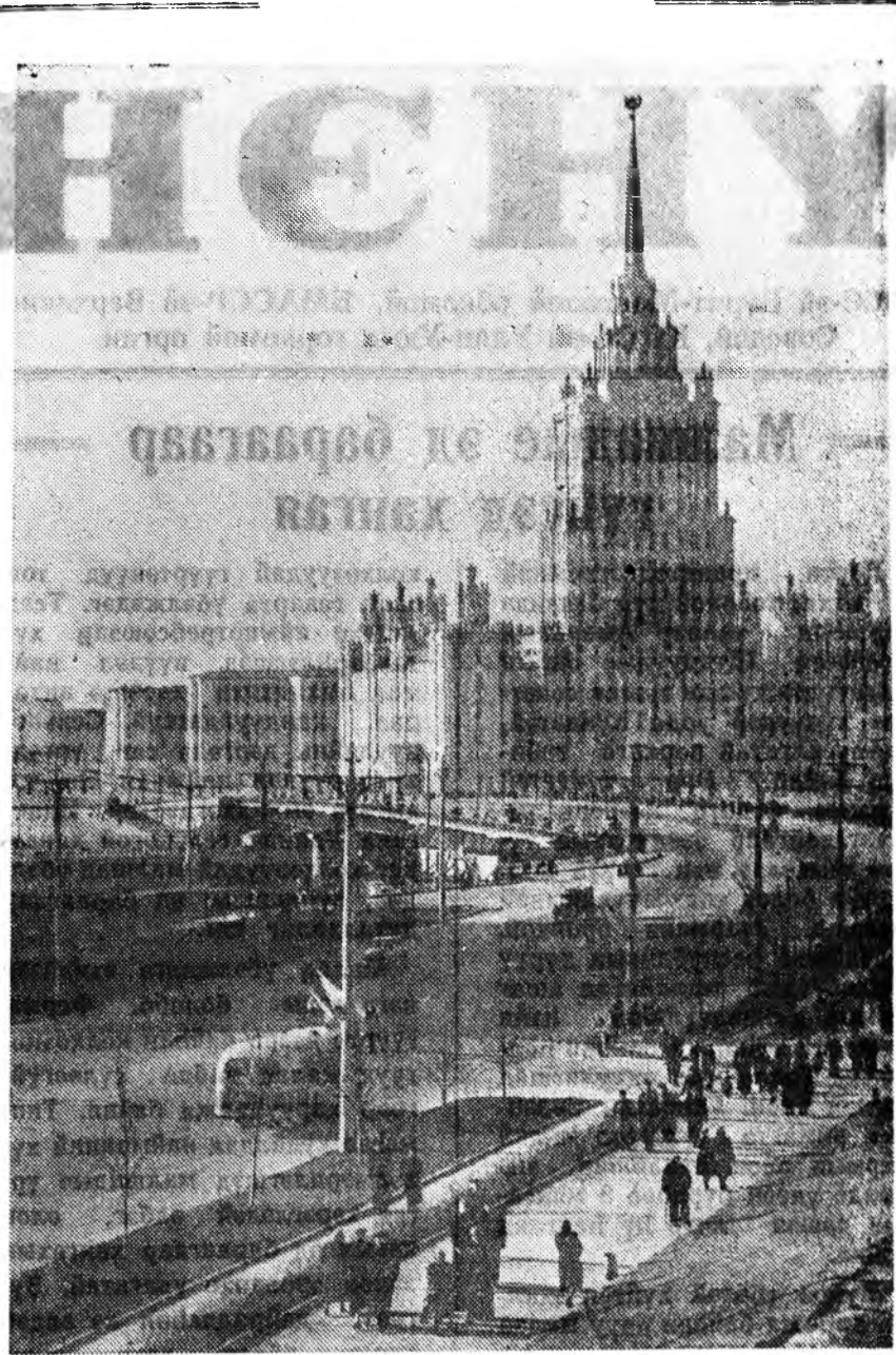
Москва. Агууеһа Октябрин социалистическа революция 40 жэлэй ойн урда тээ ороноймнай түб хотодо лэнэ үйлсэ—Шэнэ-Арбат гэжэ матициральна гол үйлсэ ашагалгада оруулагдаба.

ЗУРАГ ДЭЭРЭ: Шэнэ-Арбатын хүүргэ багта энэ үйлсын нага үчэс-ток харуулагдана.