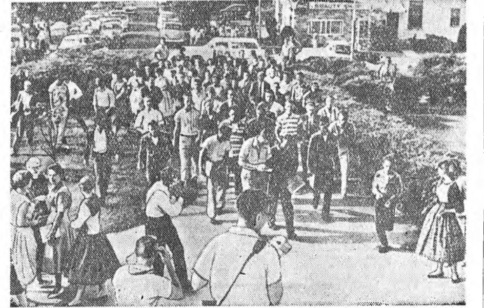
США-да негр яһатан ехээр доромжологдоно.

Америкэдэхы Литл-Рок гэжэ багхан городто ажаһуудат негрнүүд һүүлэй үелэ ехээр доромжологдоно байна. Городой гол дунда байдаг хургуулида негр 9 хурагшад орохо гэхэдэн үндэһэ яһанай илгаа гаргагшад американешууд тэдэныг шангаар хэлэжээ.