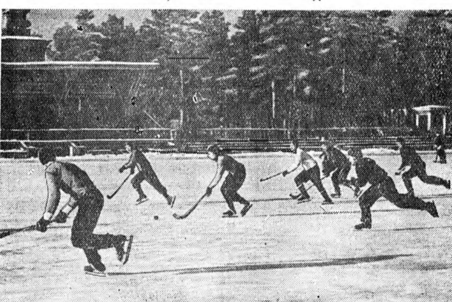
БМАССР-эй XXV жэлэй ойн нэрэмжэтэ стадиной слүүр дээрэ хоккеистнуудай мурьсөөн үнгарошье амаралтын үдэр боложо, үбэлэй спортын сезон нээгдэбэ. Нэгэ үдэрэй мурьсөөндэ «Буревестник», «Звезда», «Динамо», «Авангард», «Байкал», ПВЗ-гэй «Локомотив» команданууд хабадалсаа. Энэ мурьсөөндэ ПВЗ-гэй «Локомотив» команда илаба. ЗУРАГ ДЭЭРЭ: «Буревестник», «Звезда» командануудай наадан.

Баскетболор республикын түрүү нуури эзэлхын түлөө боложо байгаа мурьсөөндэ эршүүлэй 8, эхэнэрнүүдэй 4 команда хабадалсана. Хоёр уулзалтын дүнгүүдэй ёһоор, эхэнэрнүүдэй командануудай дундаһаа багшанарай ба институтдай суглуулагдамал команданууд шалгараа. Мурьсөөн үргэлжэлхөөр. А. Игумнов.