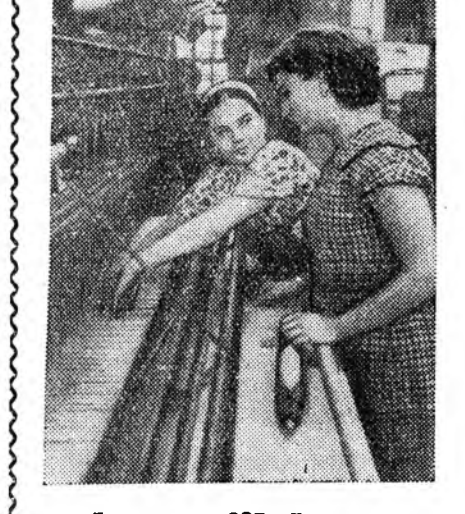
Белорусска ССР. Грозно городто Леман мурэн дээрэ нарин сэмбэ нэ-хэдэг комбинат бии юм.

ПРЕДПРИЯТИНУДАЙ ХҮДЭЛМЭРИШЭД ҮДЭРТӨӨ 7 ЧАС АЖАЛЛАДАГ БОЛОЖО БАЙНА