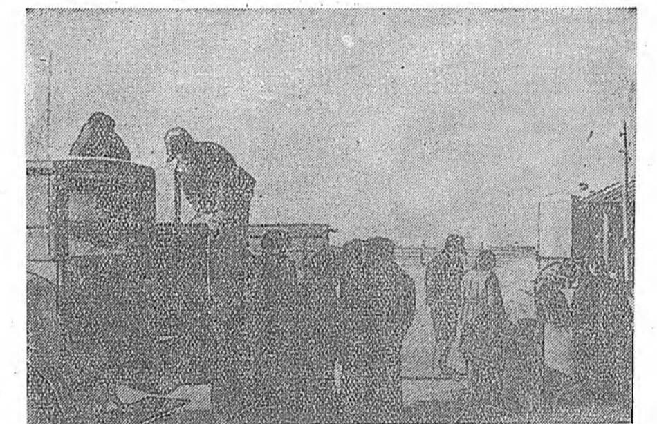
Зэдын аймагай «Октябрь» колхоздо шанинсын, хара таряанай урдаан сө...