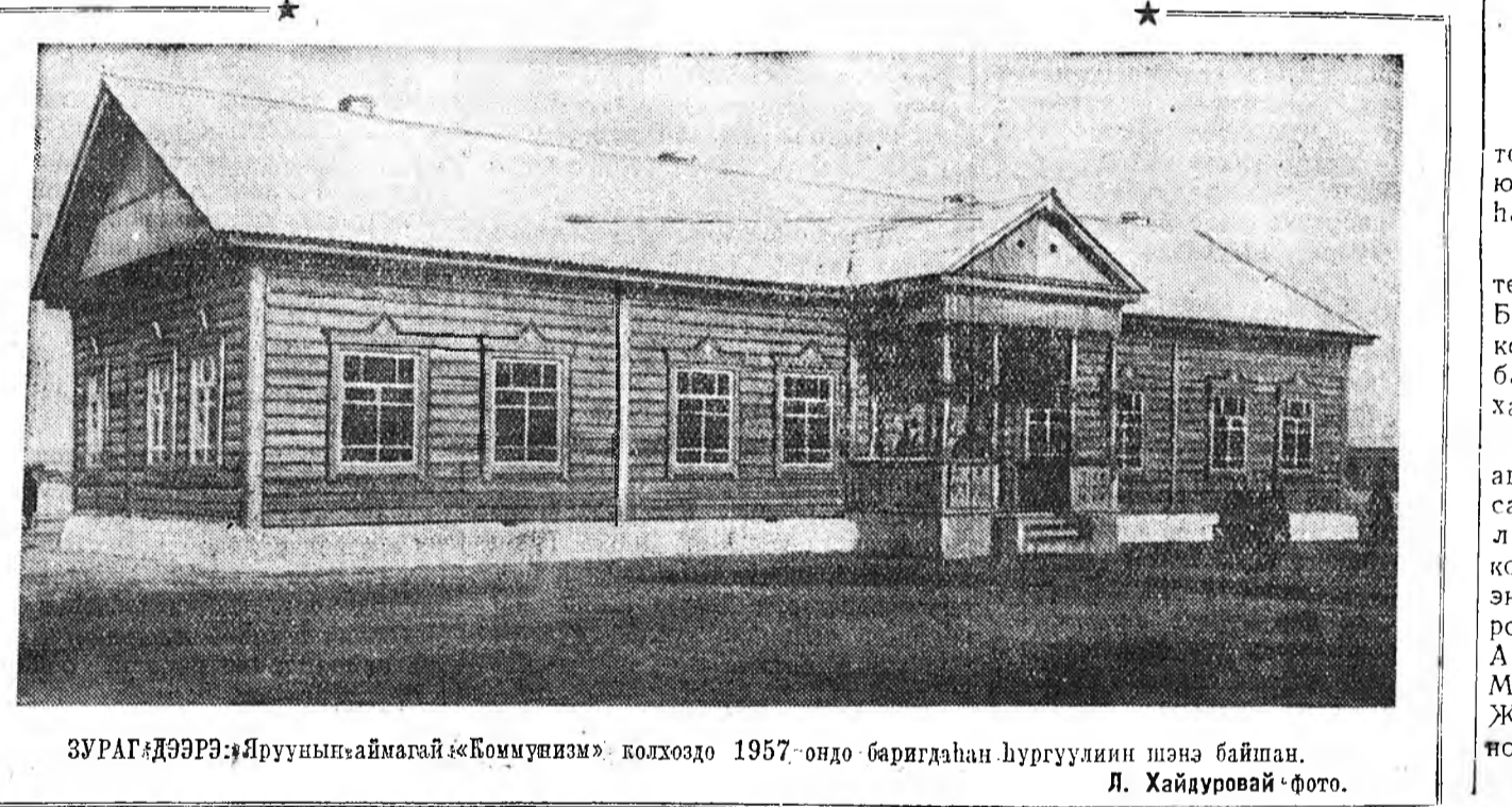
ЗУРАГ: ДЭЭРЭ: Ярууны аймагай «Коммунизм» колхоздо 1957-ондо баригданай хургуулин шэнэ байшан.