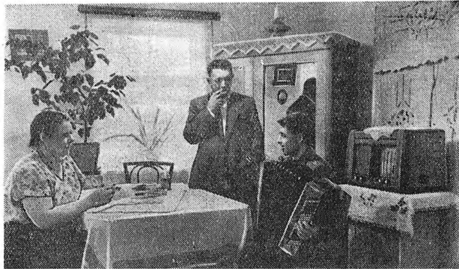
Украинска ССР. Крымскэ областин «Украина» гэжэ худөө ажахын артелиин гашууд республикын 40 жэлэй оёе амжалта ехэтэйгээр угтаа. Гол шухала культуранууд болохо үрэ жэмэс, тамхин хоёрһоод артель 3,5 миллион түхэригэй олоо оруула.