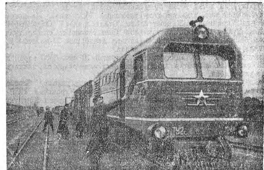
Литовско ССР. Хүнгэн түлишэ хэрэглэжэ хүдэлдэг, ТУ-2 гэжэ шэнэ 10 тепловозы Калугын завод Паневежскэ паровозно деподо үлгэбэ.

КЕРЧЬ. (ТАСС). Хара дай дээрэ, мүн тэрээрэлэн Азов далайда самолёдоор заһага бэдэрлэг болоһонһоо хойшо 1957 ондо 25 жэл гүйсэбэ.