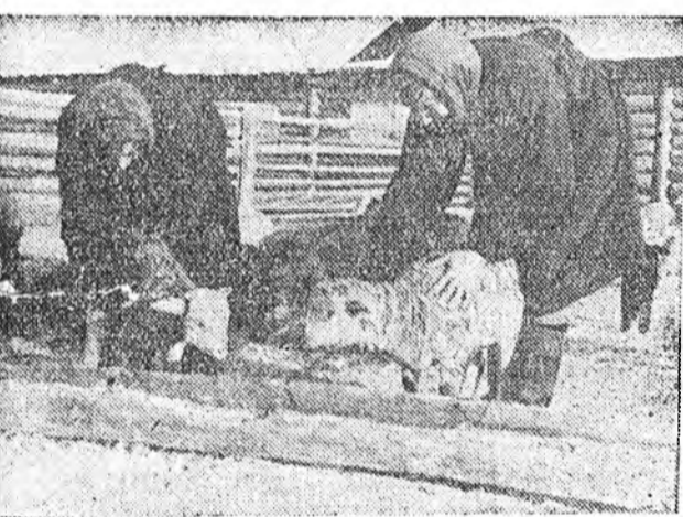
ЗУРАГ ДЭЭРЭ: хонид хурьгадые боро эсэндэ хурьга байна.