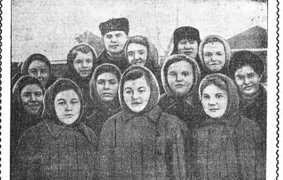
ЗУРАГ ДЭЭРЭ: хонидой хурьгалха үедэ колхоздо ошожо туһалаа үүсхэл гарһан Бурят-Монголой хүдөө ажахын техникүмэй бүлэг студентнэр.