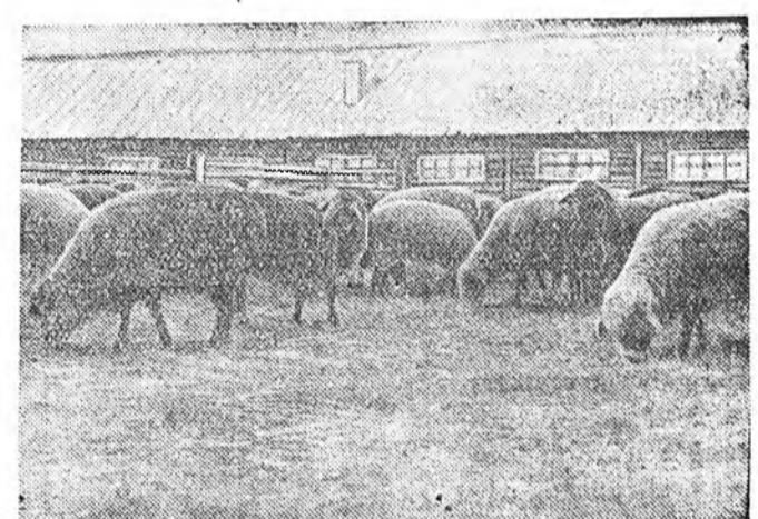
ЗУРАГ ДЭЭРЭ: эхэ хонид зельнко эдижэ байна.