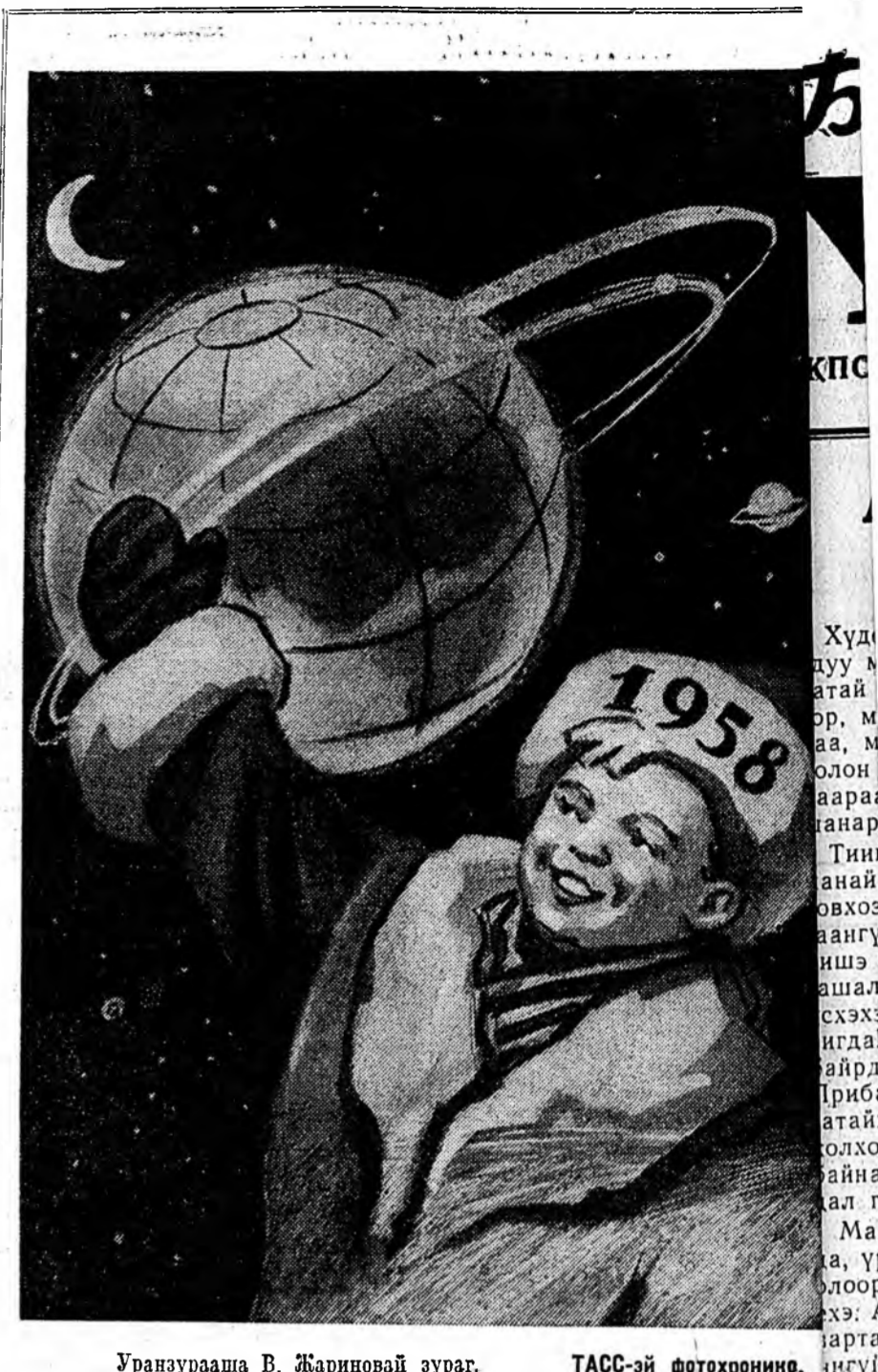
Уранзурааша В. Жариновой зураг.