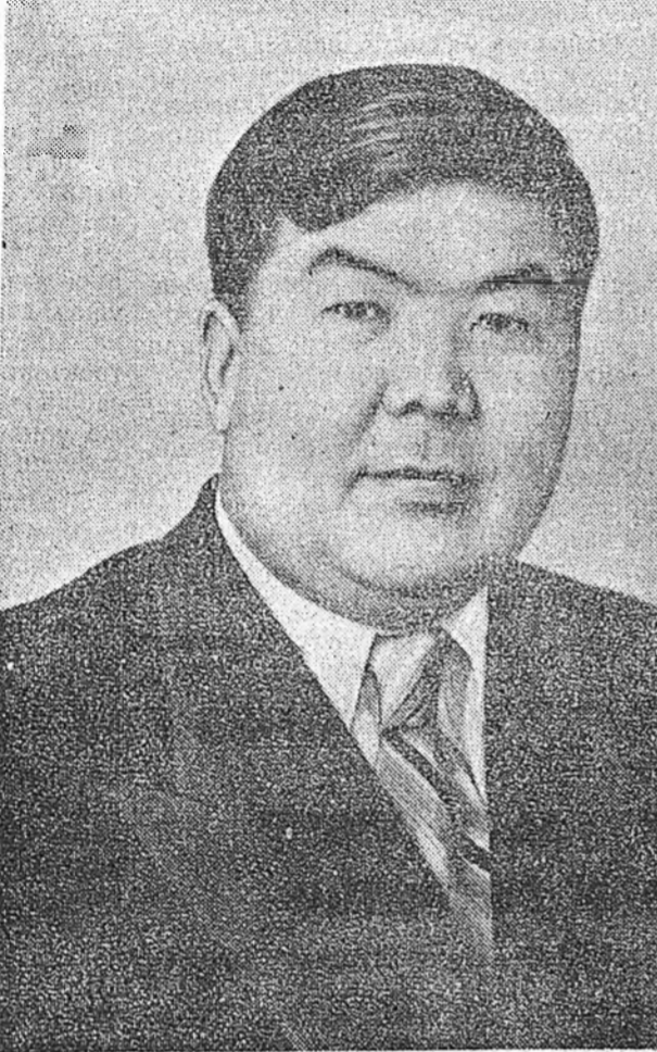
Национальностнуудай Советтэ хунгаха хунгуулин 416-дахи Тарбагатайн округ

Хунгалтын үдэр нүхэр В. Р. Филипповтэ үндэр дуугаа үгэжэ, СССР гүрэнэйнгөө засагай ехэ дээдын зургаанай депутат болгон хунгай!