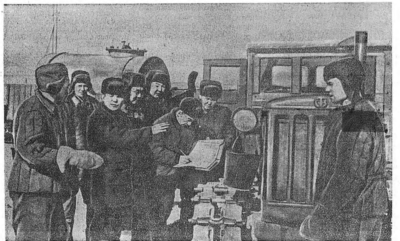
Зэдын аймагай «Коммунизм» болхоз Цагаан-Усанай МТС-һээд трактор болон хүдөө ажыхын техникэ абажа эхилээ. ЗУРАГ ДЭЭРЭ: комисси трактор шалгажа байна.