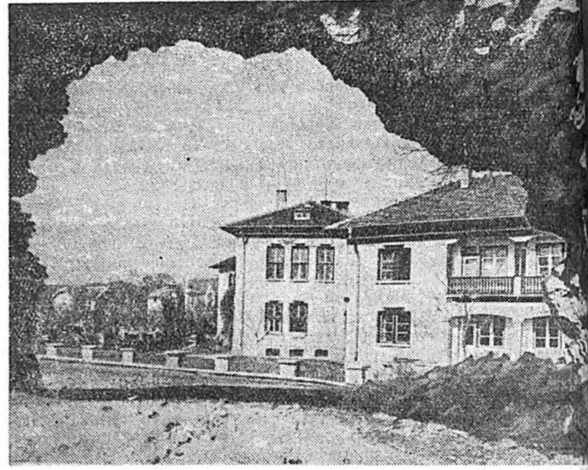
Болгарин Арадай Республика. Хисарь гэжэ курортлохи Бальнеологический санаторий.