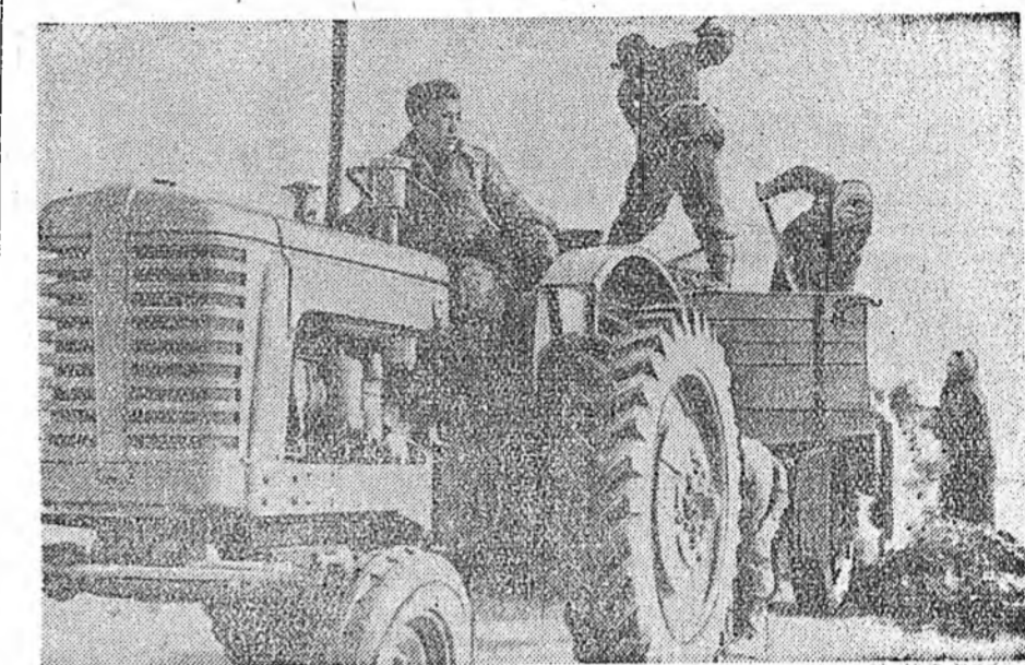
Хабарай урин дулаанай саг өрөжэ, колхозууд тарилгада бөлдхөл үргэн дэ...

Казакстанда олон колхозууд МТС-эй усадыбаанаа холо байдаг. Тиммэнэ бага сагын занбари хэжэ байха мастерской колхозуудта би болгохо, харин РТС-үүдтэ нүүдэл мастерской эмхидхэхэ гэжэ тэрэ дуралдана.