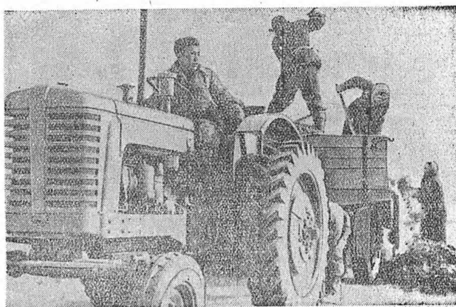
Хабарай урин дулаанай саг өрөжэ, колхозууд тарилгада бөлдхөл үргэн дэ...

28-най үдэрэй 4 ч... билгах» гэһэн нүхэр Н. С. Хрущевой элидхэлээр үгэ хэлэлгэ эхилбэ.