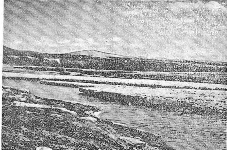
Уда гол урдаха ойртоо...