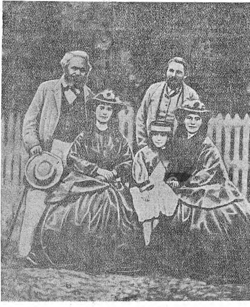
К. Маркс, Ф. Энгельс, В. Ленин. (XIX зуун жэлэй 60-дахн онуудай өхн).

Совет засагай тогтоһонхоо хойшо К. Маркс, Ф. Энгельсын зохиолууд манай орон дотор 69 хэлэн дээрэ, хамтадаа 71 миллион хэһэгээр хэблэгдээ. Карл Маркс, Фридрих Энгельсын бэшээн «Коммунистическэ партин манифест» СССР-тэ 336 дахин, 63 хэлэн дээрэ, 13 миллион шахуу хэһэгээр толилогдоһон байна. Энэ зохиол мүн бүрт хэлэн дээрэ оршуулагдан хэблэгдээ. К. Марксын «Капитал» гэжэ зохиолынь Советскэ Союзта 138 дахин, 14 хэлэн дээрэ, 3,6 миллион хэһэгээр толилогдоо.