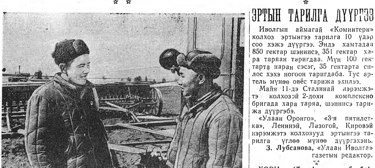
Иволгын аймагай «Улаан Оронго» колхозой 1-дөхи комплексно бригада колхоз соогоо тарилгын эхэ газартай юм. Эдэнэр энэ хабартаа 2000 шахуу гектарта тарилга хэжэ.