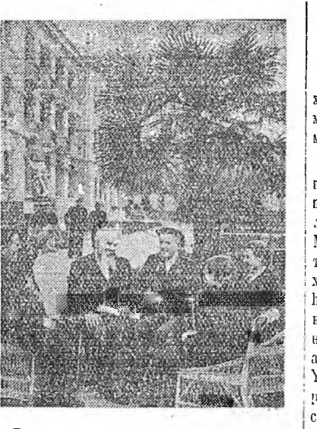
Сочи. «Волга» гэжэ санаторидо 150 хүнэй байха шөнэ корпус нёдондо жэжэй июльд баригдаа һэн. Мүнөө энэ санаторидо 200 гаран хүн амарна, аргалуулжа бөйнхай. Зураг дээрэ: Горьковский областын амархаа эрэнэн хунууд санаторион шэнэ корпусой наада талада хөөрөлдөжэ һууна. ТАСС-эй фотохронико.