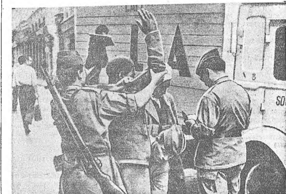
Алжиртахи событнуул. ЗУРАГ ДЭЭРЭ: Касабын (Алжир городой арабуудай хуулар квартал) үйлсэнүүдэй нэгэнда французска патруль нотагай нэгэ хүнниэ нэгэжэ байна.