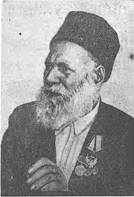
До Ажалай Улаан Тугай орденуор шагнадаһан юм.

Колхозойнгоо ажалда таһалгаряагүйгөөр хүдэлмэрилжэ байһан, Айвазов үбэжөөл 148 наһанайнгаа ой-