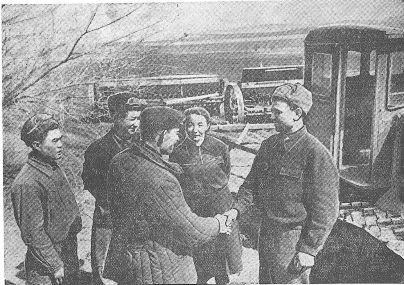
XX партсьездын нэрэмжэтэ колхозой (Зэдэ) хоёрдохн комплексно бригадынхид аймаг соогоо түрүүлэн эртын тарилга дүүргэ. Зураг дээрэ: хоёрдохн комплексно бригадын бригадир нү-