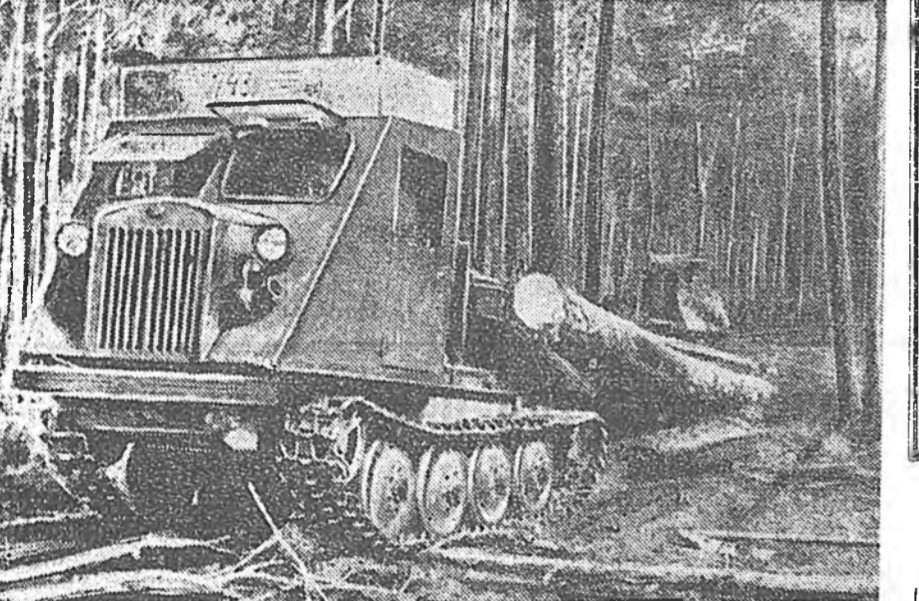
ЗУРАГ ДЭЭРЭ: «Механлит» заводто капиталнаар заһабарилгадан «КДТ-40» маркын модо шэрэдэг трактор харуулагдана.