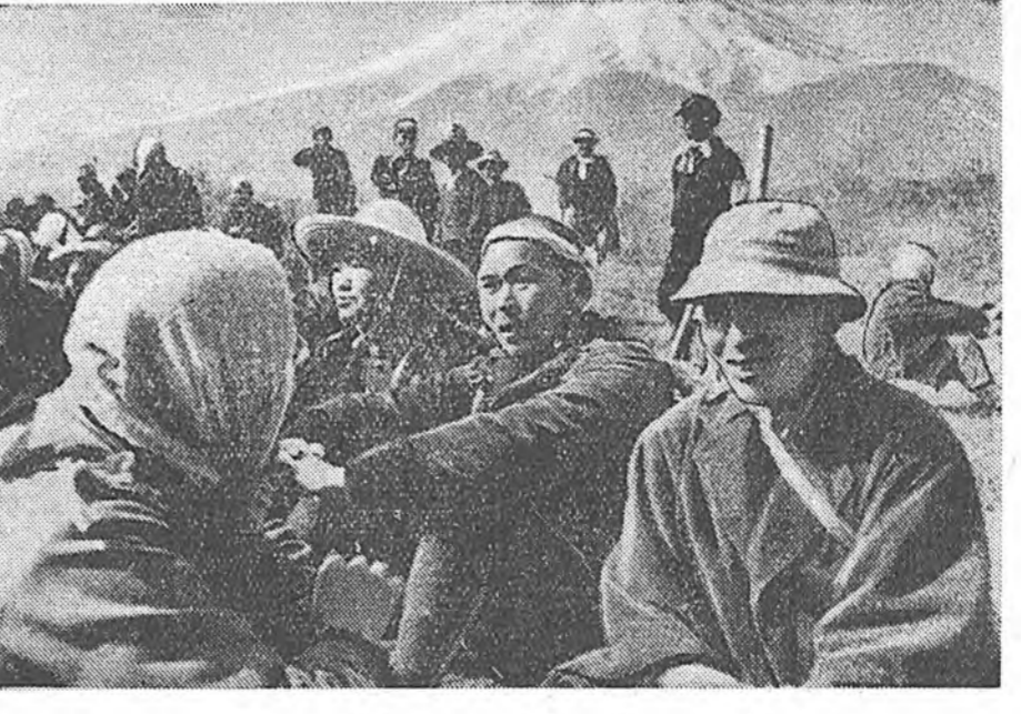
Япон. Фудзияма хадн хойто талын районо урдан байһан американска полигоние Японой правительствэ өөрыгөө ээбсэгтэ хуануудта зориулан хэрэгдэхые һанаашала байһай. Энэ район шадарай тосхонуудай 500 шахуу таршаа эндэ демонстраци һаяхан хэб. Тэдннэ буляжа абаһан газарые бусаха тухай таршаад арилтэ хэһэн байна. Зураг дээрэ: таршаад Фудзияма хадн бооридо суглардаг байна.