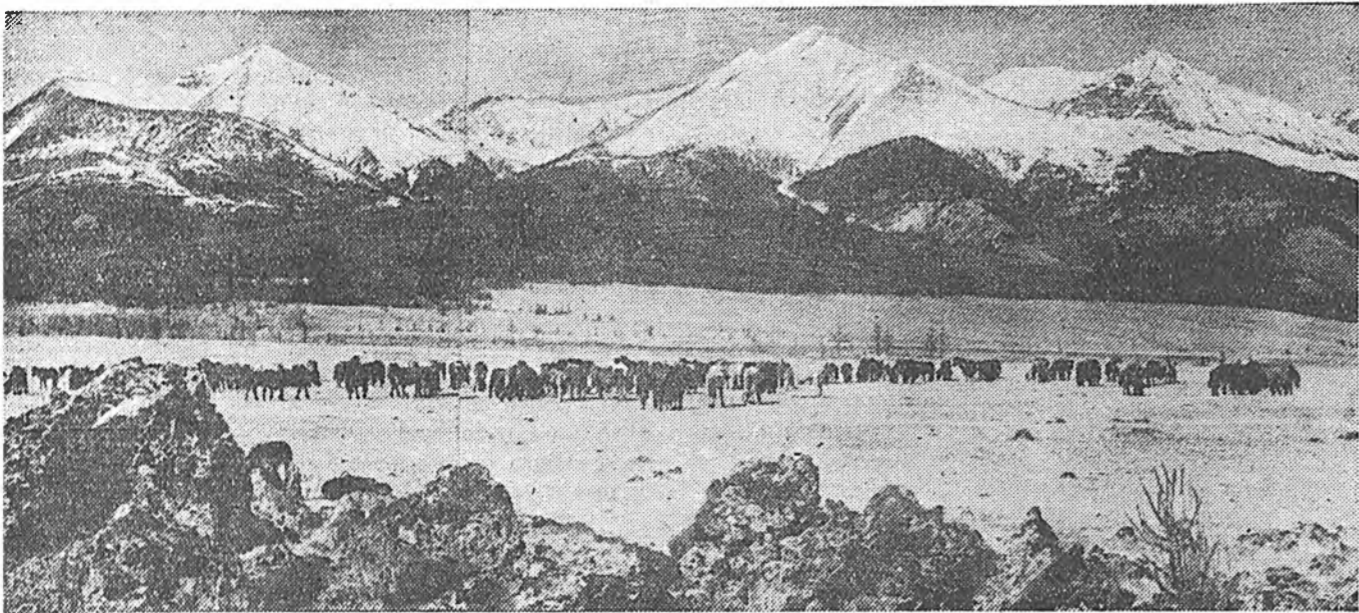
Саян уулын хормойдо.