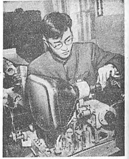
Хятадай Арадай Республика. Панкнай электромлануудые гаргадаг заводто түрүүшын телевизионно кинескопууд наада олоор гаргадажа захилхана ЗУРАГ ДЭЭРЭ: бэлэн болоһон кинескоп шалгардажа байна.

Ойро зуура аабарлалгын болоһоной нүүдээр БКП-гэй ЦК-гэй тоосоото элдхэл, Центральна шалгалтын комиссин элдхэл тушаа үгэ хэлэлдэ эхилээ.