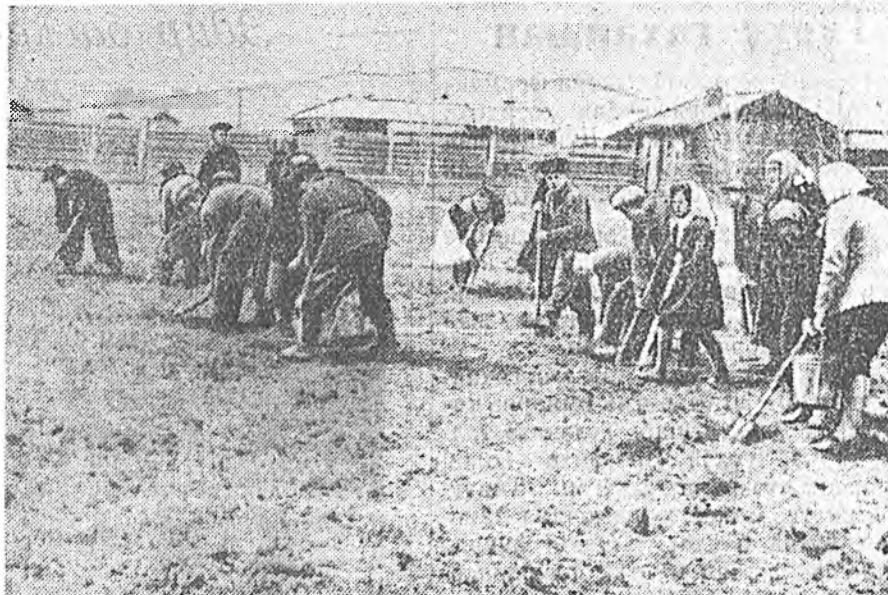
Харганагай долоон жалэй хургуулин (Швога) бурагшад түрэл колхозһоо хоёр га газар даажа абаад, хартааба тариха гэжэ шиндэһэн юм. Гектар бүриһөө 200 центнерһээ доошо бэшэ хартааба ургуулха уялга абанхай. Зураг дээрэ: бурагшад хартааба буулгажа байна.

Мэнэ наяхан манай аймагай луговодууд Сэлэнгын аймагай «Путь Ильича», 18 партсездын, Тельманэй нэрэмжэтэ колхозуудай луговодуудай дүршэлтэй хоёр үдэрэй туршдаа танилсажа эрээ. Тэндэхи уһалуурин системэнүүд инженернэ гуримаар баригдана байна. Тинимэ луговодуудай хүдэлмэри бураггүй хүнгэрнэ. Энэнтэй дашарамдуулан, манай аймагай уһалуурин системэнүүд оһьножоруулагдаагүй гэжэ сэхэ руун мэдүүлхэ байнаб. Саашаа аймагай, колхозуудай хүтэлбэрлэгшэд уһалуурин системэнүүды ёһотой инженернэ эрилтэн ёһоор шэнэдхэн бариха тухай хэмжээ абхаа бээ гэжэ найдагдана.