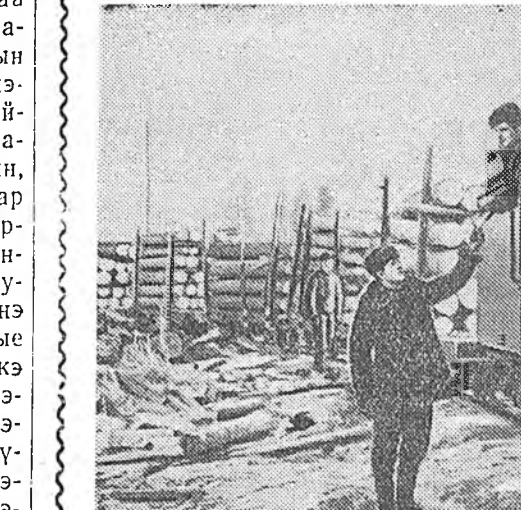
ЗУРАГ ДЭЭРЭ: модо ашаһан поезд Хандагатайн леспромхозһоо ябахая байна.

арга боломжонуд Иркутска област- до бин юм. Шулуу нүүрһэн, мине- ральна даһан, шэветяк, модон болон Ангарай үнэгүй электроэнерги, теплостанцинууд хадаа шэнгэн ту- лина, пластмасс, хэмэл утһа, ноо- ло, целлюлоза, кислота, үтэгжүүлгэ матые ехээр үйлдэбэрлэхэ арга олго- но. Мүнөөшье область дотор хими- ческэ нэгэ хэды предприятинууд ху- дэлжэ байдаг.