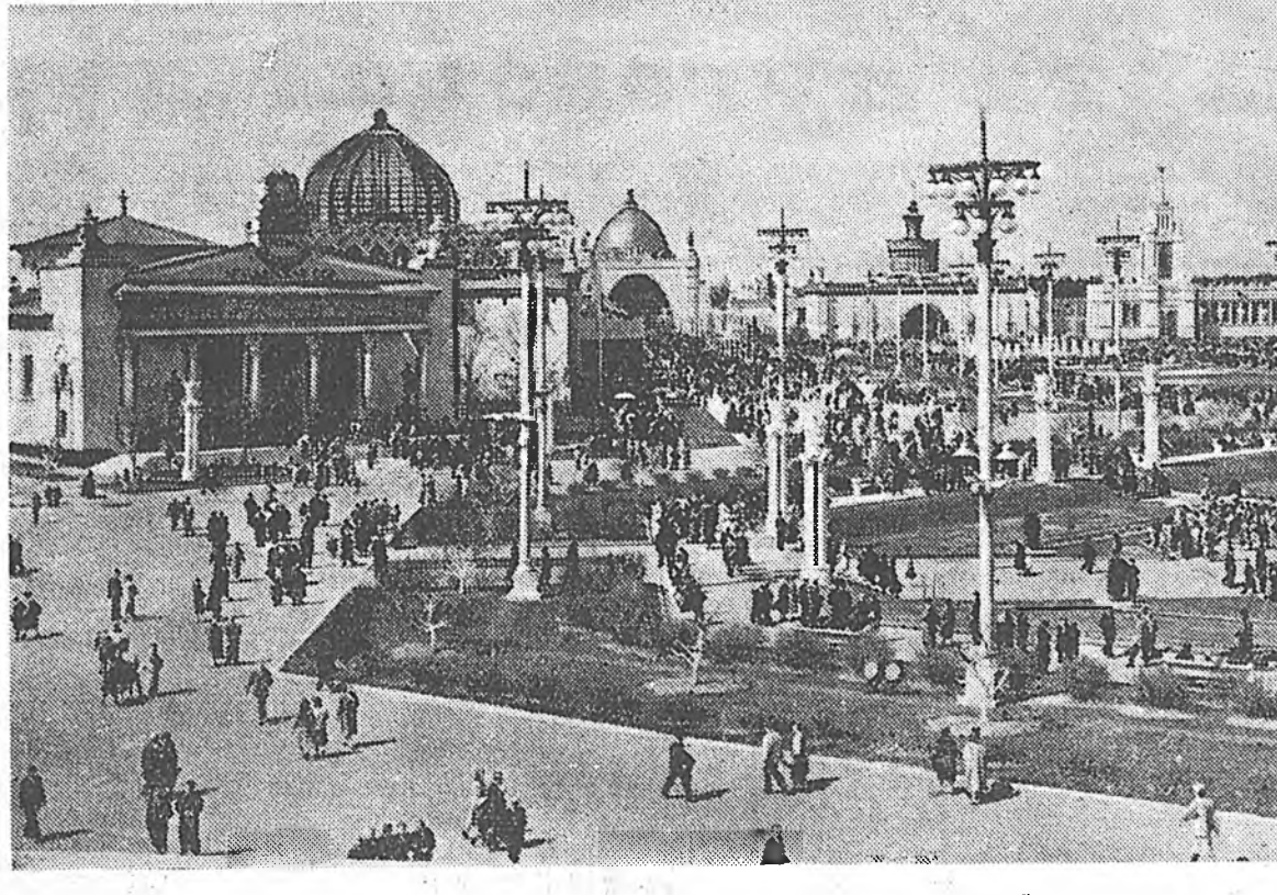
Москва. Бүхэсоюзна хүдөө ажахын выставкэ. Зураг дээрэ: колхозуудай талмай.