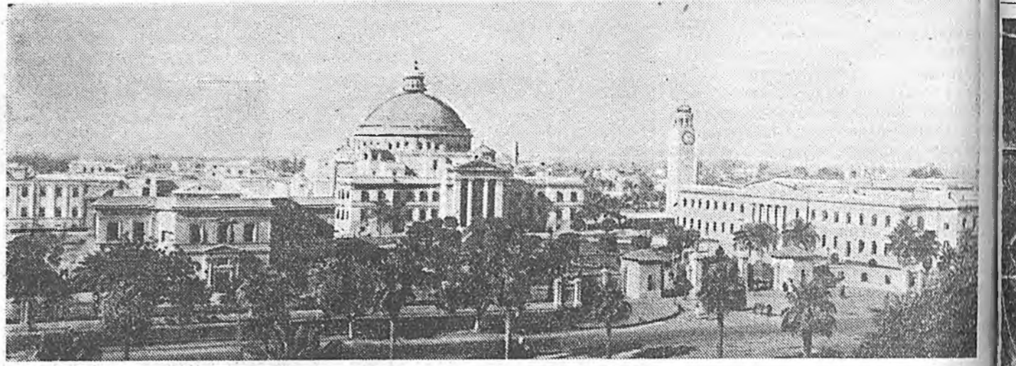
Арабуудай Нэгэдэмэт Республика (Египетскэ район). Зураг дээрэ: Каирый университет. Редактор Ц. Ц. ЦИБУДЕЕВ.

шууд негрүүдэй нотагай организацинуудай түлөөлэгшэнэртэй хөөрлөөдөө, негр зоной ажабайдалтай танилсаа. США-гэй демократическа партини удмаршадтай нэгэн Э. Стивенсонтэй делегаци уулзажа, хөөрлөөдөн байна. Делегацини гшүүд телевиденер үгэ хэлэжэ. Советскэ Союздахи ажабайдал тухай дэлгэрэнгүй хөөржэ үгһэн байна. Вашингтондо байха үелдэ делегацине США-гэй вице-президент Никсон, демократическа болон республиканска партинуудай центрайна хүтэлбэрлэнэ түлөөлэгшэд, буу зэбсэг хураха талаар сенатай комиссини түрүүлэгшэ сенатор-демократ Хэмфри урижа уулзаһан байна. Хэлбэлэй национальна клуб соо советскэ делегацини хүндэлэлдэ зорюулагдан обод хөглэһэн байна. Тэрэн дээрэ США-гэй конгрессэй гшүүд, дипломатическа корпусой гшүүд, американска болон бусад оронүүдэй журналистнууд байлсаа.