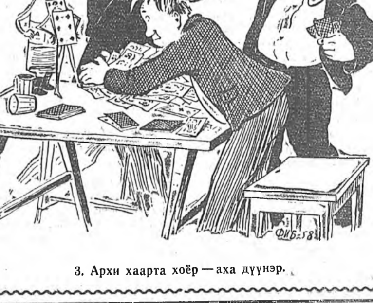
3. Архи хаарта хоёр — аха дүүнэр.