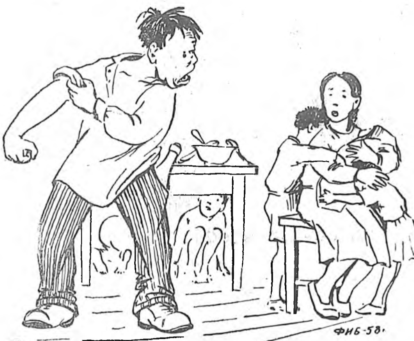
— Баабайн хубуунэй нодарга дааха хүн байна гү?! Үтэр гарагыг наашаа!.. Ф. БАЛДАЕВАЙ зураг.