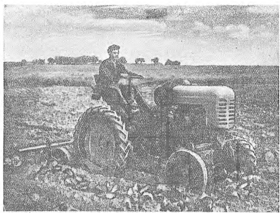
Иволгин Лазогей нэрэмжэтэ колхозой огородой эдээн найнаар ургала байна. Огородой бригадынхид ургасын хойнохо эрхмн найнаар харуулаха. Илагшаа залуу тракторист Леонид Астраханцев ургаса харууналгада эдэхитэй оролдосотойгоор ябана. Тэрэ халаанайнгаа даалгабарине 150—200 процент дүүргэдэг заншалтай. Зураг дээр: тракторист Леонид Астраханцев капустын ургасада зурууд хоорондын элдүүрилгэ хэжэ байна.

Курумканай Лениний нэрэмжэтэ колхоздо 40 хүн набаһата тэжээл бэлдэгдэ ябажа, 2 үдэрэй туршада 150 центнер бэлдэб. Энэ жэлдэ хонин бүридэ 1 центнер гэхэ гү, алж хамтадаа 350 тоно набаһата тэжээл бэлдэгдэхэ юм. Гаядаа үбнэ сабшажа эхилхэн, 14 звеноноо бүридээн 6 бригада