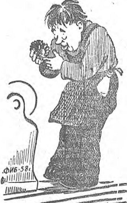
Архин халуун Ажалда харша. Архинша хүнүүд Аралта харша.