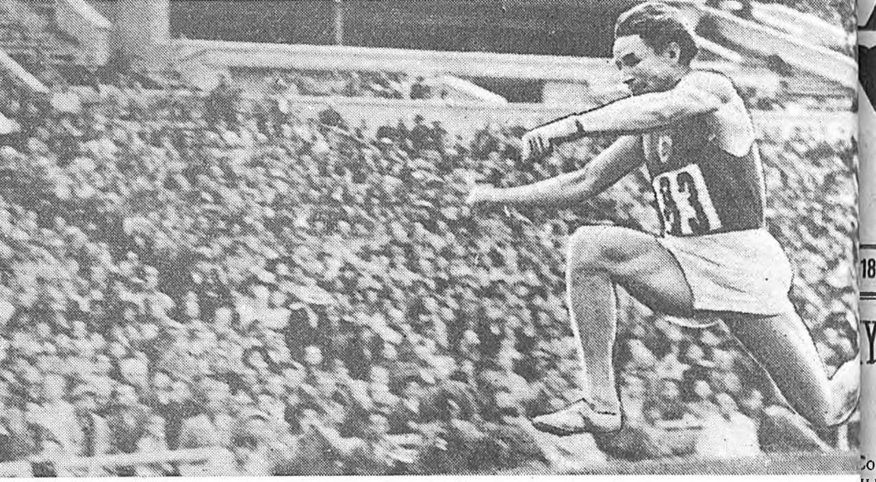
абажа, дэлхэйн шэнэ рекорд тогтоогоод, нэгдэхэ хуури эзэлһэн Рафер (США) байна. Хажуудан хоёрдох хуури эзэлһэн советскэ спортсмен Кузнецов зогсоно. 2. Турбан дахар утын харайгаар нэгдэхэ хуури эзэлһэн Ряховский (СССР) харайжа ябана. Тэрэ 16 метр 59 сантиметр харайжа, урданай рекордые 3 сантиметрээр үчүүлээ. ТАСС-эй фотохроника.